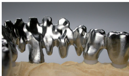
Forma® Implant Bridge