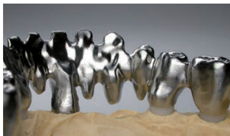
Forma® Implant Bridge